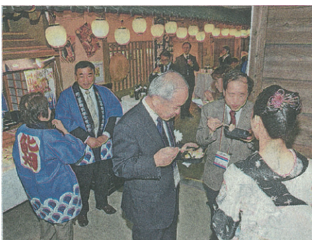
岡山城天守閣で料理を味わう参加者ら

や県酒造組合など7企業・団体がブースを設け、県産シカ肉ステーキ、瀬戸内海で捕れたサワラやタイの海鮮丼、雄町米で醸造した日本酒などを振る舞った。