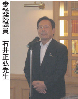
参議院議員 石井正弘先生