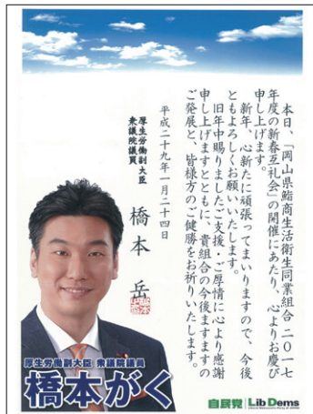
厚生労働大臣 衆議院議員 橋本がく様より