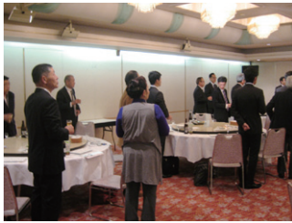
①来賓のご挨拶。(国会議員の先生方は国会中のため欠席) 岡山県議会議員(当組)