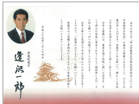
衆議院議員 逢沢一郎様より