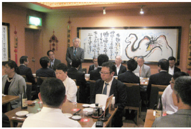
来賓を交えての合同懇親会

在が必要不可欠です。競争が激化する中で、一他店ではなく、自店を選んで「もらえらる」コンセプトづくりが必要だと思えます。今の時代の繁栄店は、立地・商品・サービス・価値などの面で顧客にとって「価値」を明確に確立しているため、市場規模は小さくはなりながらここ数年は上昇傾向が続いていると言われていますが、飲食店の現状を見ると他の業態に顧客が流れていることは確かです。それは、コンビニやスーパー、デパ地下等の充実した流通やプランディングなどにより外食をしなくても十分な食事がとれ、イトインのスペースもありその場で食べるスタイルも普及していますが、外食産業の現在と未来の課題に向けて、「すし」は、我が国固有の食べ物から国際的な食べ物へと変化し兆しが広がっている。昨今、私達業界にとって手をつなぐべき課題は自店の価値をつくり磨き上げていくことがさらに私たちに求められているのではないのでしょうか。