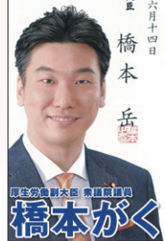
衆議院議員 橋本 岳

本日、「岡山県商生活衛生同業組合」平成二十九年六月十三日通常総会、懇親会が開催されましたこと、心からお慶び申し上げます。 本日は、実り多き総会となりますようお祈り申し上げますとともに、今後とも、お互いに交流と連携の輪を広げ、今後も地域経済の発展のために協力し合えようようお願ひ申し上げます。 最後にありますが、貴組合のさらなるご発展と、ご参集の皆様方のご健康、ご多幸を祈念いたしまして挨拶とさせていただきます。