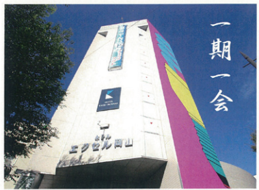
マイカルレゾナンス作岡山山交後 2016

この度は、お忙しい中お会いできる機会をいただきまして誠にありがとうございました。このご縁を大切にしていきたいと思っております。今後ともよろしくお願ひいたします。