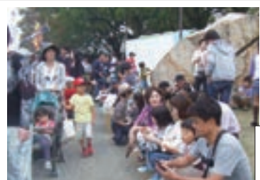
食べたいものを食べてちょっとひと休み