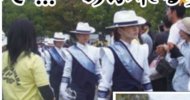
石山公園でのマーチングバンドを終えて