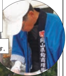
吉祥の岡氏、頑張って作っています。