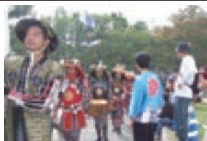
石山公園でのイベントが終わって