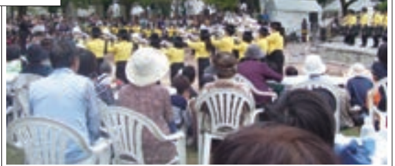
石山公園でのおかやま国際音楽祭

「秋のおかやま桃太郎まつり」が10月11日、岡山市中心部で開催した。13日までの3日間、岡山の食、芸能、歴史をテーマにした多彩な催しを展開。初日は爽やかな秋空の下、大勢の家族連れらが詰め掛け、郷土芸能や当地グルメなどを堪能した。