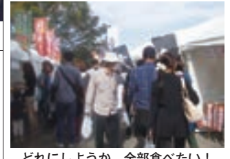
どれにしようか 全部食べたい!