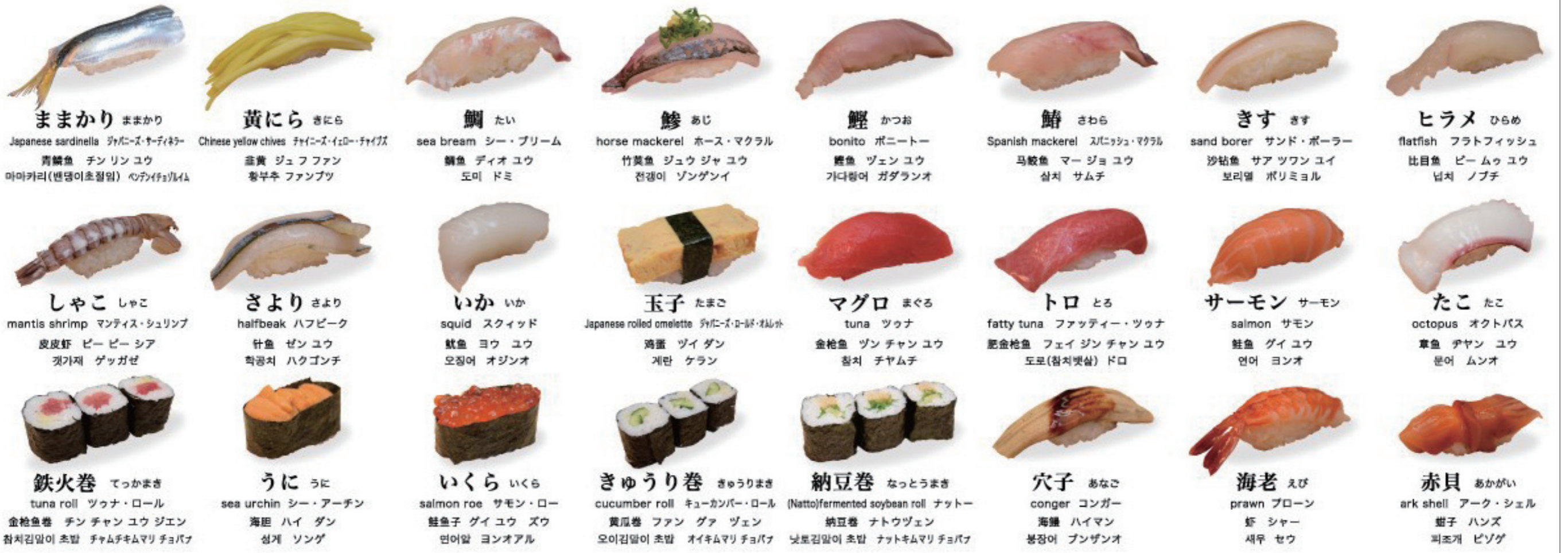
ままかり ままかり Japanese sardinella ジャパニーズ・サディネラ 青鱈魚 チン リン ユウ 마마카리(병당이초절임) 베타인치리미