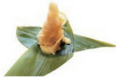
アワビ あわび abalone アバローネ 鮑魚 バアオユウ 전복 쏬복