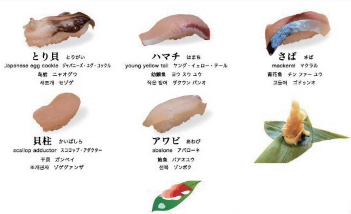
とり貝 とりがい Japanese egg cockle ジャパニーズ・エッグ・コックル 烏蛤 ニャオグウ 새조개 세조개