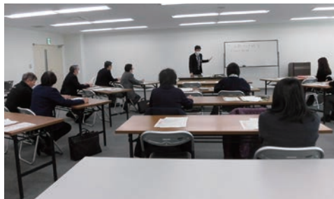
新型コロナウイルスに関する対応緊急融資説明会 於：日本政策金融公庫岡山支店6階

ことが見込まれること。この貸付を希望される組合員の方は、必要な書類を用意の上、最寄りの日本制作金融公庫の各支店窓口でご相談ください。必要書類 ①「振興事業に係る資金証明書」→組合本部で発行します。 ②「新型コロナウイルス感染症の発生による影響に関する確認資料」→組合本部にご確認くださいます。 ③「新型コロナウイルス感染症の発生による影響に関する確認資料」→組合本部にご確認くださいます。