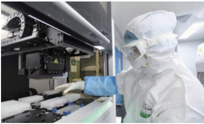
2020年2月6日、中国湖北省武漢市の「火眼」研究所で、検査技師が新しいコロナウイルスの検査を受ける人から採取したサンプルを調査している

年、中国出身の邱香果 (Xiangguo Qiu) 博士とその夫である成克定 (Keiding Chang) 博士が、王立カナダ騎馬警察 (RCMP) によって知的財産窃盗の疑いでカナダのウィネペグ市にある国立微生物研究所 (NMI) から連行された。この研究所はカナダ唯一のレベル4の微生物学研究所、つまり中国が武漢市で運営しているものと同じ種類の研究所である。Q氏はエボラウイルスの研究者として知られており、夫はSARSに關する研究を発表している。RCMPの調査によれば、両者がたびたび武漢の研究所へ戻っていたことも明らかになっている。