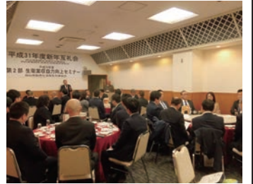
ただければと思います。お忙しいところ御来賓の皆様、賛助会の皆様、組合員の皆様、そしてこのセミナーに時間をさいて、ご出席を頂いた方々に厚く御礼申し上げます。

時間の都合でこのような段取りとなつてしまいましたが、まい先生方も話づらいかもしれませんが、気になさらずに進めてい